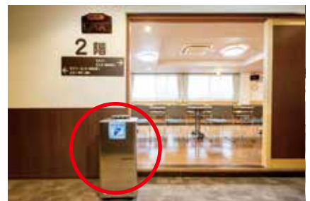
二酸化塩素噴霧装置

2階の会場は70名様まで、 70名を超える場合は1階レストラン（40名様前後）と合わせて対応します。