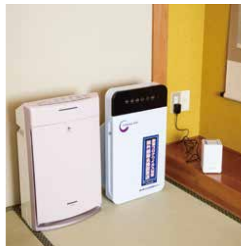
空気清浄機・紫外線除菌機・ クレベリン発生装置