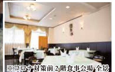
※コロナ対策前2階食事会場 全景