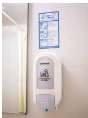
客室トイレの ディスペンサー