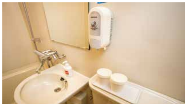
洗面台に うがい用紙コップを設置