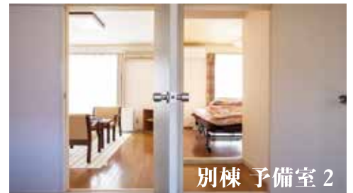
別棟 予備室 2

玄関、フロント、各階廊下、各客室に手指用消毒液（またはジェル）を用意していますので、こまめな消毒をお願いいたします。