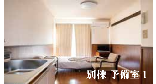
別棟 予備室 1