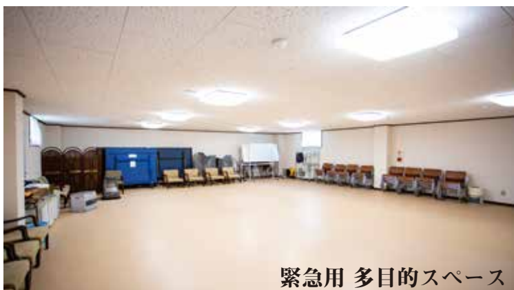
緊急用 多目的スペース