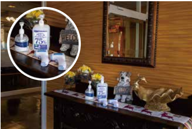
玄関【消毒液 + 非接触式体温計】

玄関、フロント、各階廊下、各客室に手指用消毒液（またはジェル）を用意していますので、こまめな消毒をお願いいたします。