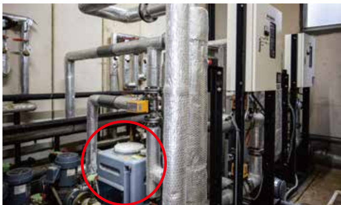
塩素系滅菌剤 投入装置

大浴場の浴槽には感染症を防ぐために濾過したお湯に 塩素系滅菌剤 を投入して循環させています。