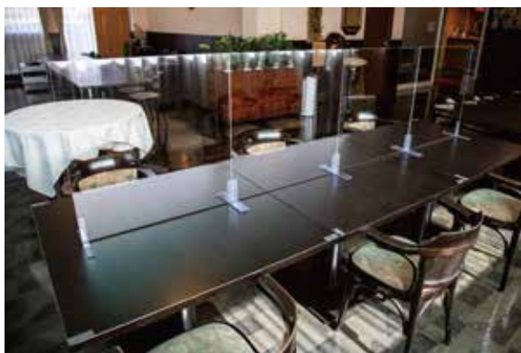
1階食事会場使用時のアクリルボード

2階の会場は70名様まで、 70名を超える場合は1階レストラン（40名様前後）と合わせて対応します。