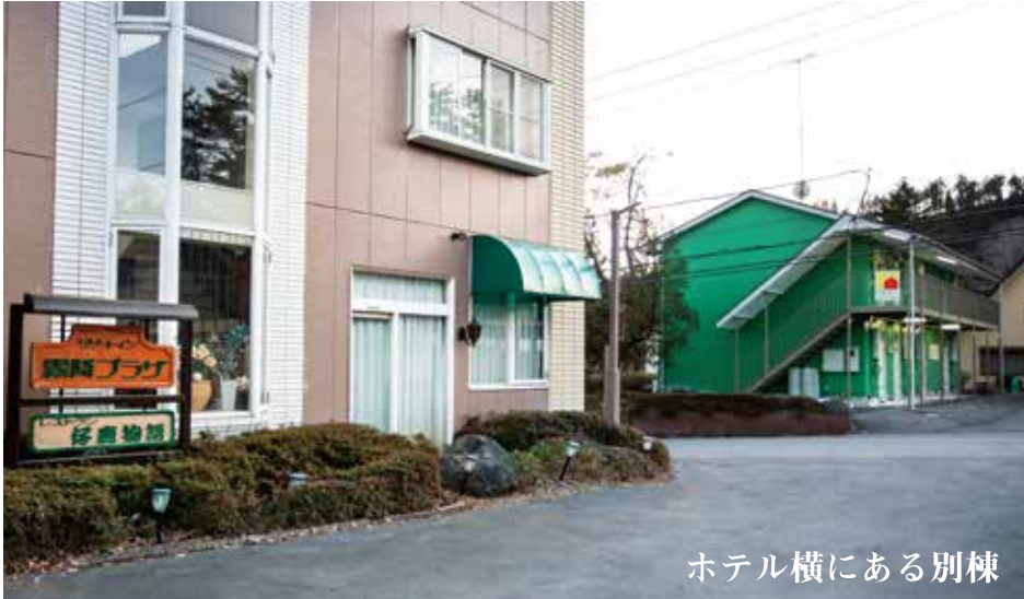
ホテル横にある別棟

入館時、非接触式体温計で 37.5℃ 以上ある場合は体温計により測定しなおし、それでも 37.5℃ 以上ある場合、その他体調不良がある場合には入館できません。 別棟にある予備室にて待機して頂き、速やかに医療機関への受診を打診いたします。 病院への送迎は、状況に応じて対応いたします。 ※ ご家族のお迎えをお願いする場合がございます。