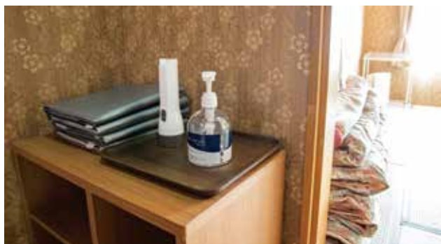
客室設置の 手指用消毒液等

うがい用の紙コップを人数分ご用意します。紙コップに記名後、うがいの徹底をお願いします。