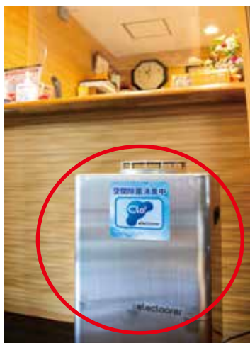
フロント前に設置してある 二酸化塩素噴霧装置