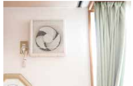
2階食事会場の換気扇